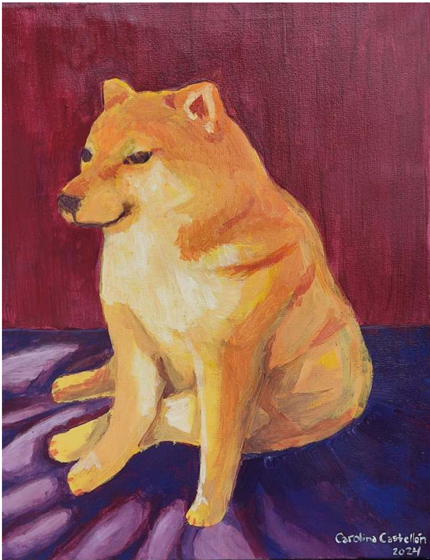
Un “ cheems ” Comisión en acrílico

Obra para la celebración de Los Farolitos de Ahuachapan , Titulada “Curiosidad en la noche”. 61cm x 45cm. Vendida. 2024